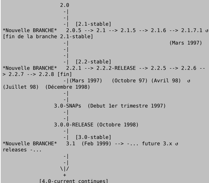
Figure 1.1. L'arbre de développement

La branche -current progresse lentement vers la version 4.0 et au-delà, la branche 2.2-stable étant terminée avec la version 2.2.8. La branche 3.0-stable l'a maintenant remplacée, la prochaine version arrivant avec la 3.1 au début 1999 . La version 4.0-current est maintenant la "branche courante" avec les premières versions 4.0 apparaissant au premier trimestre 2000.